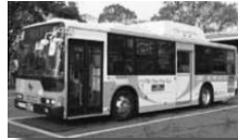
CNG(圧縮天然ガス)バス

従来と同じ燃料(軽油)を使用しディーゼルエンジンですが、過去に比べると驚くほど排気ガスがきれいで、ハイブリッドバスやCNGバスに引けを取らないバスです。