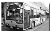
平成25年式ノンステップバス(低排出ガス認定車)

燃料に軽油を使うディーゼルエンジンとモーターを組み合わせた、ハイブリッドバス。環境に優しい乗り物です。