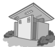
都立公園のトイレ

2017年度は、公立小中学校に13億2,600万円、都営地下鉄の28駅分に11億8,100万円を計上しました。それぞれ、2020年までに8割から9割の整備完了を目指します。