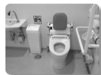
多目的（だれでも）トイレ 車いす回転スペース・オストメイトも備えている

今までの多目的トイレも男女共用ですが、車いすが回転できるスペースが必要で設置数が限られます。今後、「男女共用トイレ」を設置することで、性的少数者などの利用によって多目的トイレに集中することが避けられます。